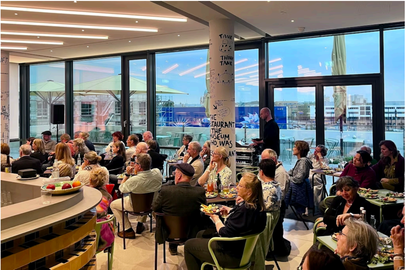
Großer Andrang im Café Hedwig